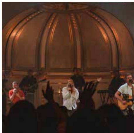
Liveinspelning Pingst Kreativ